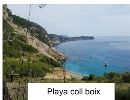
Playa coll boix