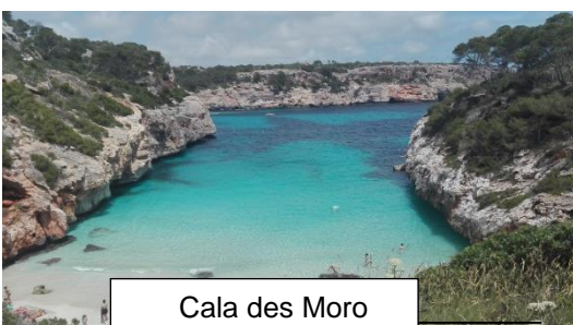
Cala des Moro